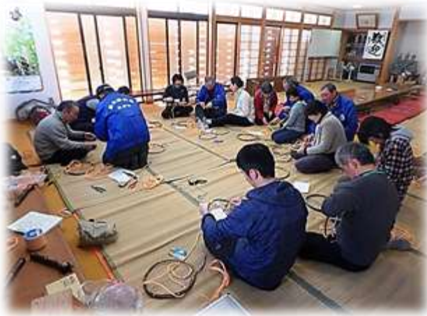
手回し道具で蕎麦打ち 集会所でかんじき作り