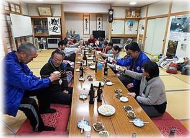
キャンドルのおもてなし みんな一緒に交流会