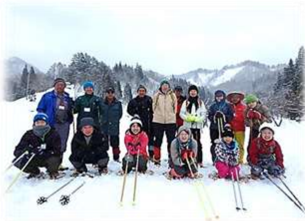
かんじきを履いて散策 雪山トレッキングへ出発