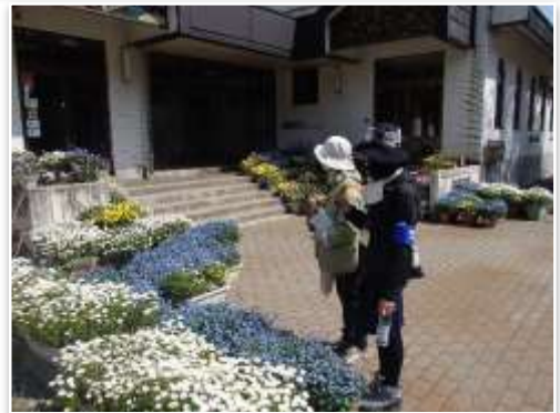
↑三島小学校の花、とても喜ばれました