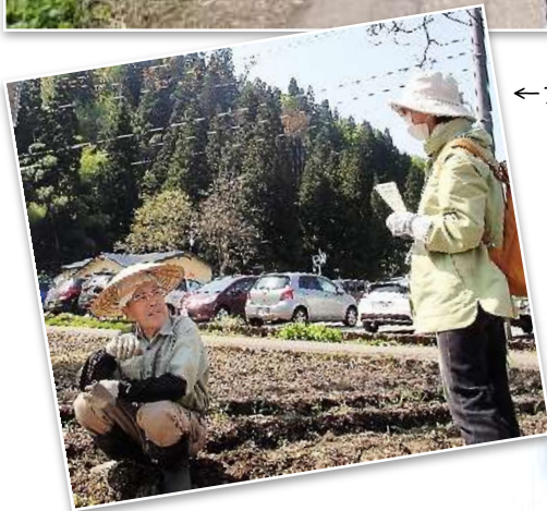
←さんぽ中に会った 畑仕事中的 おじちゃんとお話し