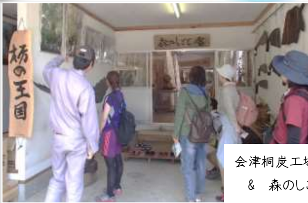
会津桐炭工場 & 森のしごと舎