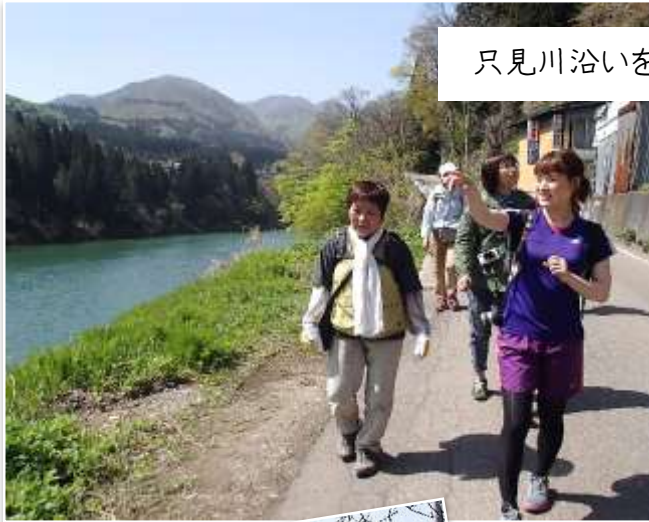
只見川沿いをのんびりさんぽ