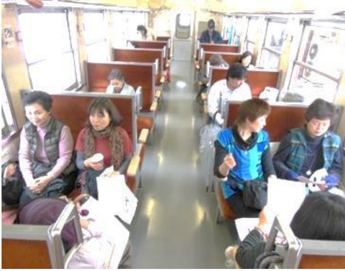
◆ 只見線は久しぶりという人も ◆ 会津若松までは約80分の旅