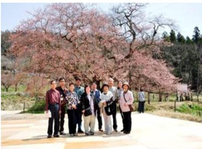
◆ 二十一日は宮川の満開の桜と ◆ 十六日、一分咲きの石部桜と