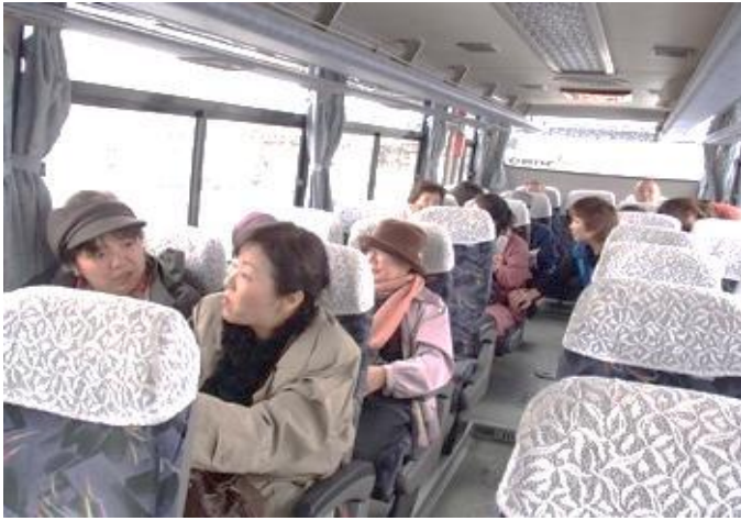
◆ バスガイドさんと石部桜へ ◆ 貸切バスに乗換えて出発