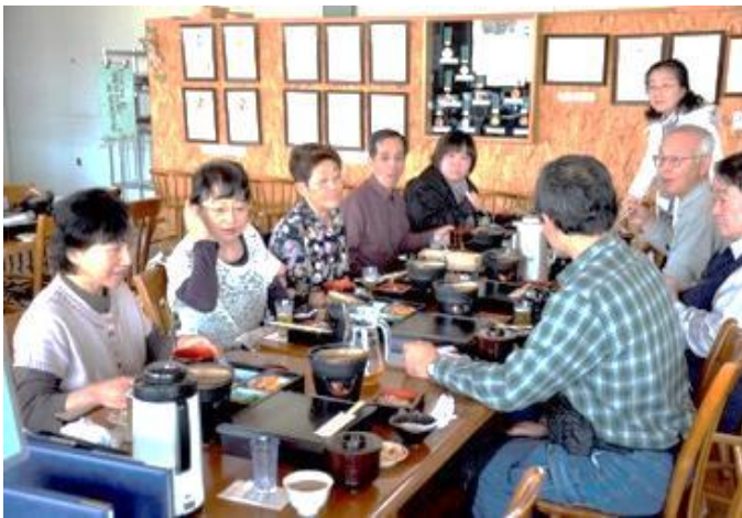
◆ 地ビールの試飲付が好評！ ◆ 昼食は猪苗代地ビール館で