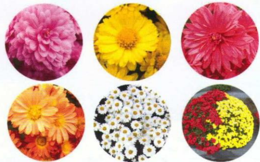
色によっては開花時期が少しずつずれます