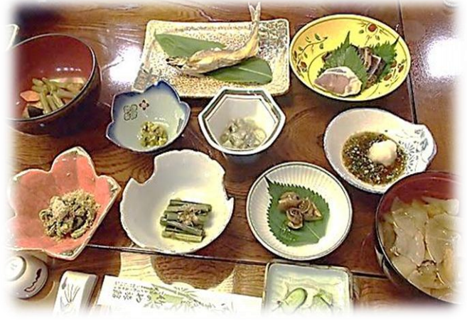
竹のや旅館さんに宿泊