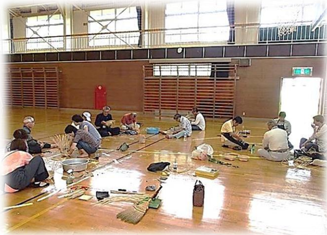
カタクリ体育館でザル作り