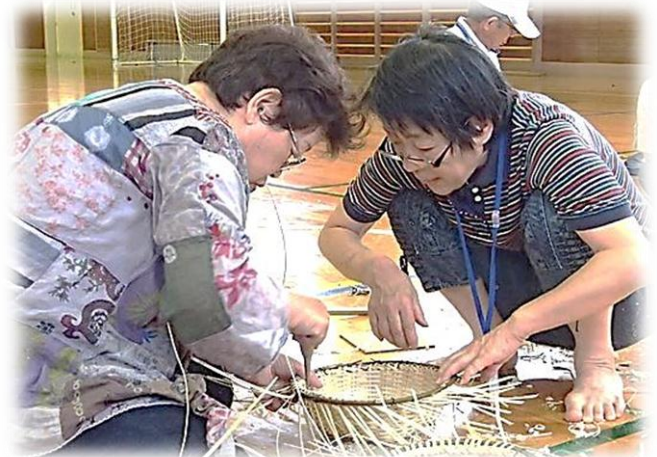
参加者同士で確認中