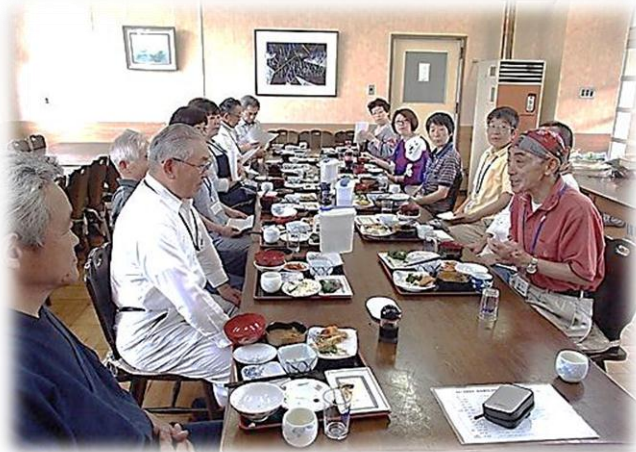
2日間の感想を共有