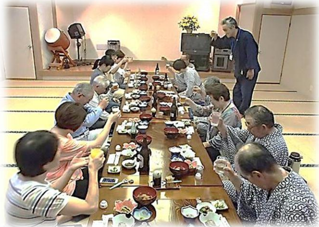
夜はみんなので交流会