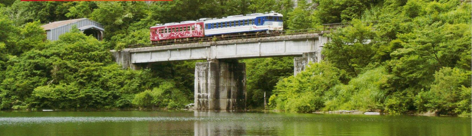
湖上からの只見線の列車(旧田子倉駅付近、7月撮影)