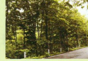
国道沿いに広がるブナ林