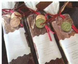
f leur de bonheur