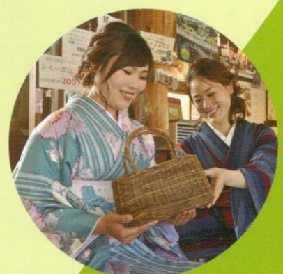
三島伝統工芸品、「編み組みバッグ」。