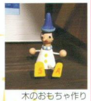
木のおもちゃ作り