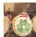
カスタネット デコレーション