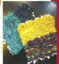
裂き織りコースター