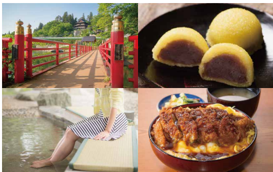
(左上) 清姫橋と圓藏寺 (左下) 足湯

※月曜日(祝日の場合は翌火曜日)は三島町観光交流館からんころんの定休日のため三島での乗り捨てはできません。 ※台数に限りがありますので、事前にお問い合わせのうえご予約ください。